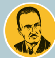
Premio Nacional de Narrativa y Ensayo "José María Arguedas"

Dirección General de Educación Básica Regular Dirección de Educación Física y Deporte Dirección de Educación Secundaria 2022