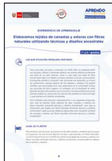
Intercultural bilingüe (Ámbitos Amazónicos y andinos)