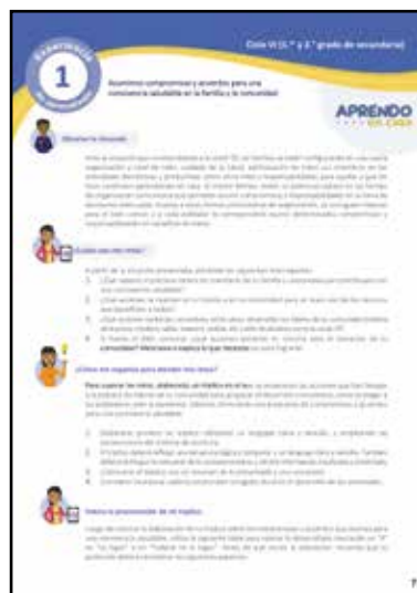
Modelos educativos rurales (Residencia, Tutorial y Alternancia)